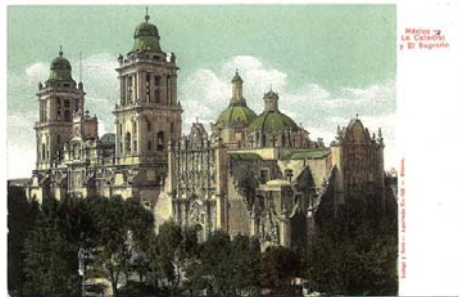
Sagrario, Ciudad de México.

Barroco es una palabra que viene del portugués y significa "perla irregular". Si bien es cierto que en cada país donde se desarrolló adoptó un nombre particular, en el mundo entero este primer nombre es bien conocido. El estilo barroco se extendió a todas las artes, imponiéndoles el culto a la virtuosidad y la fantasía, dándole a las obras un toque más caprichoso, pero de no menos calidad.