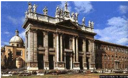
Basílica de Letrán.

Documentos fidedignos nos prueban que los cristianos en un principio se reunían en habitaciones particulares para celebrar los Santos Misterios, y que luego estas casas fueron donadas a la iglesia con este fin sagrado. Pronto, con el aumento de la comunidad cristiana, no fueron suficientes estos edificios para tales reuniones, por lo que los fieles aprovecharon períodos de paz para edificar basílicas que no han subsistido. En tiempos de Constantino, se multiplicaron los templos cristianos, creándose dos corrientes basilicales principales: la occidental, que originará el arte románico, y la oriental, que originará el arte bizantino.