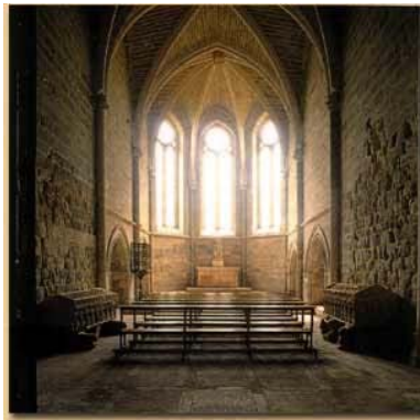
Claustrum de las huelgas.

Románico es una palabra proveniente de la filología, que llama románicas a las nuevas lenguas provenientes del latín. Para nuestros efectos, la utilizaremos para indicar las producciones artísticas de los pueblos occidentales de Europa que tuvieron como base el arte romano.