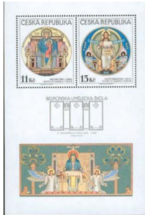
Escuela de Beuron.

Desde el punto de vista artístico, los siglos XIX y XX son, en general, siglos de imitación; la capital de las artes es París y no Roma. Claramente se aprecia una falta de originalidad, salvo contadas excepciones.