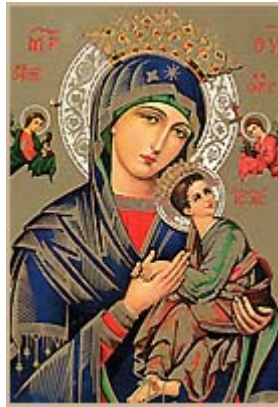
Nuestra Señora del perpetuo socorro.

El arte bizantino es la continuación privada del arte imperial romano, profundamente modificado por la influencia artística de Persia, Armenia, Siria y Egipto.