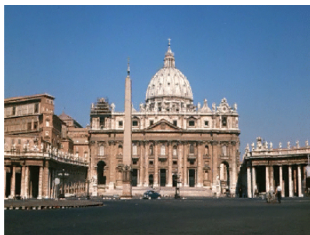
Basílica de San Pedro

Este nombre viene del resurgimiento de las tendencias grecorromanas usadas cuando Roma era señora del mundo. Surge principalmente en Italia dado que el estilo gótico no fue de mucha aceptación general.