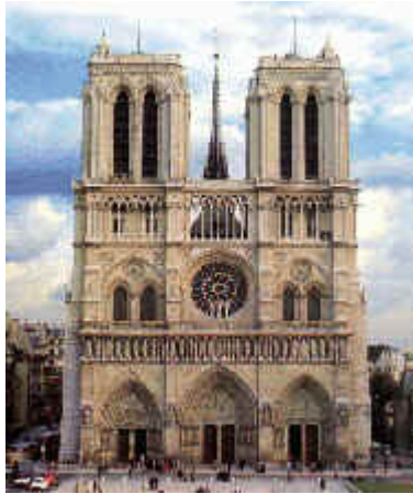
Catedral de Notre Dame.

El arte gótico es el desarrollo lógico del arte románico. Surge como consecuencia del perfeccionamiento de características específicas del período anterior, como por ejemplo, la ausencia de luz en los templos.